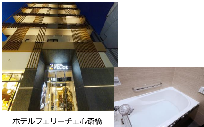
ホテルフェリーチェ心齋橋