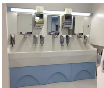
手洗い水装置 ザウバーゾーン