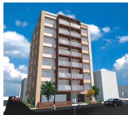
2020年12月竣工予定 アクティブシニア向け住宅 (吹田市)

介護施設ではマイクロバブルトルネードを導入することにより、入浴介助が見守りになったとご好評いただいています。また、2020年12月には株式会社プロパティ・ケアが運営するアクティブシニア向け住宅(仮称)に、見守り付きマイクロバブルトルネード「ミラバス・ガーディアン」を全戸導入決定。全国でも初めての試みとなります。