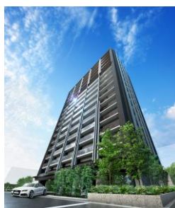
レーベン金沢 MID WEST TOWER

タカラレーベンのマンションでは、 たからのマイクロバブルトルネード O2、 たからの水、たからのミラブルを標準装備。 これまでに約2万戸に導入。他社との差別化を後押ししています。